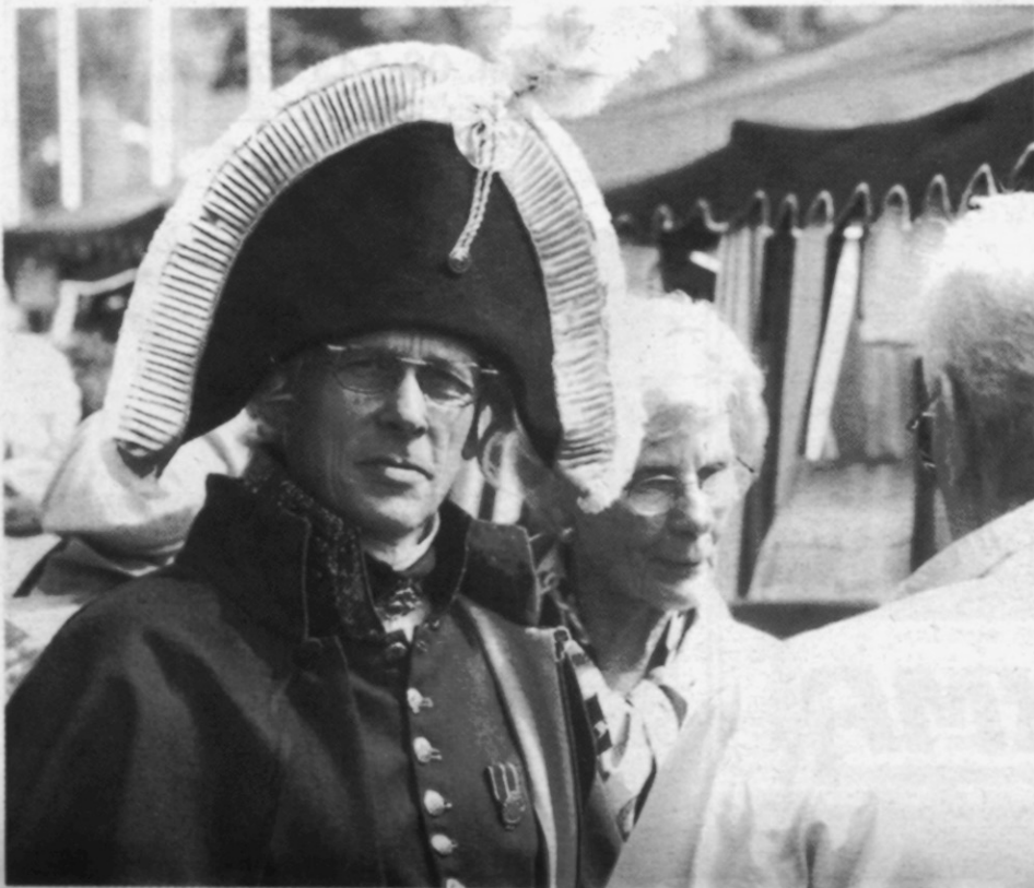
Blicken hos en sjöofficer från Österbotten är inte att leka med

Redan till nästa år kan Skärgårdsmässan i Vasahamnen växa till en samlingspunkt för Östersjöns alla kuststater och deras skärgårdar. Mässan blev i år en stor framgång med rekordpublik. Starkt bidragande till detta var en rejäl satsning från Österbottens skärgård.